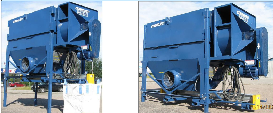
MODÈLE ASPECTAIR 12000 CFM AVEC ET SANS PATTES